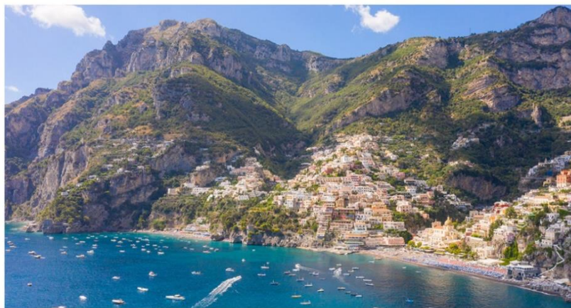
L'île de Capri.